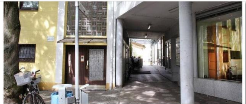
Ein Vorschlag: Die Kornsturm-gasse – hier von der Wallstraße aus gesehen – soll barrierefrei ausgebaut werden.