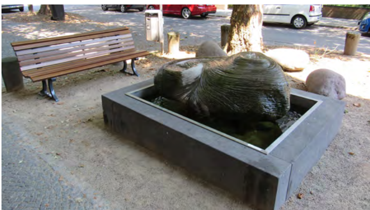
BAUMSCHEIBE NACH DER GESTALTUNG