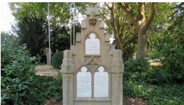
NEU INSZENIERTER GEDENKSTEIN