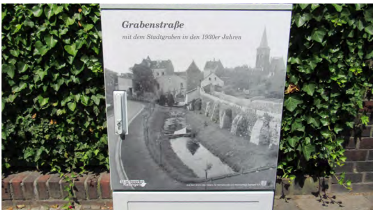
AUFGEWERTETER STROMKASTEN GRABENSTRASSE