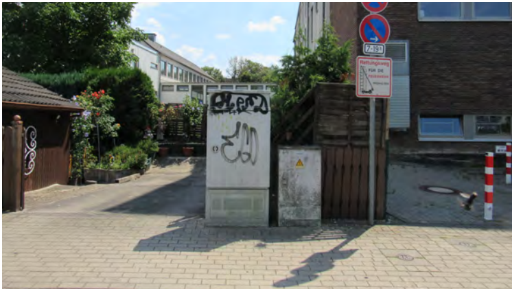
STROMKASTEN VOR DER AUFWERTUNG