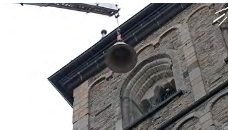
EINBAU DER GLOCKE