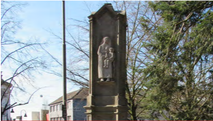
BEWAHRUNG DES HISTORISCHEN ERBES