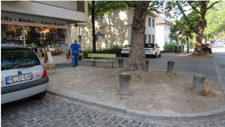
BAUMSCHEIBE VOR DER GESTALTUNG