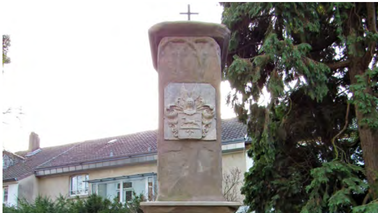
BEWAHRUNG DES HISTORISCHEN ERBES