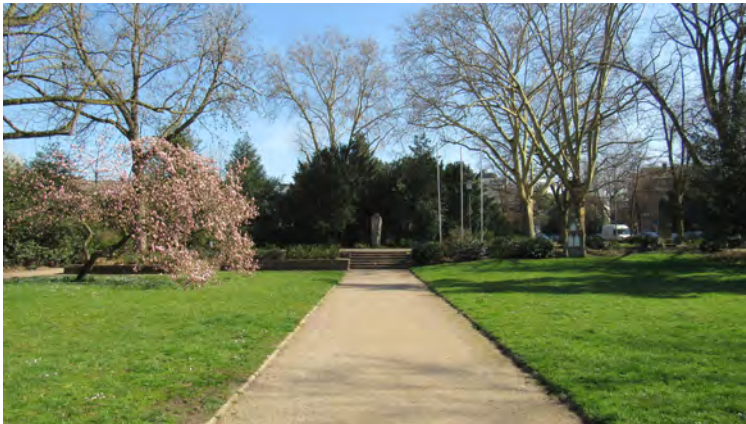
NEU GESTALTETE WEGE