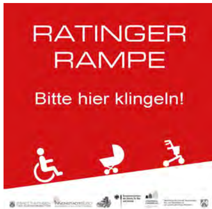
AUFKLEBER ALS HINWEIS