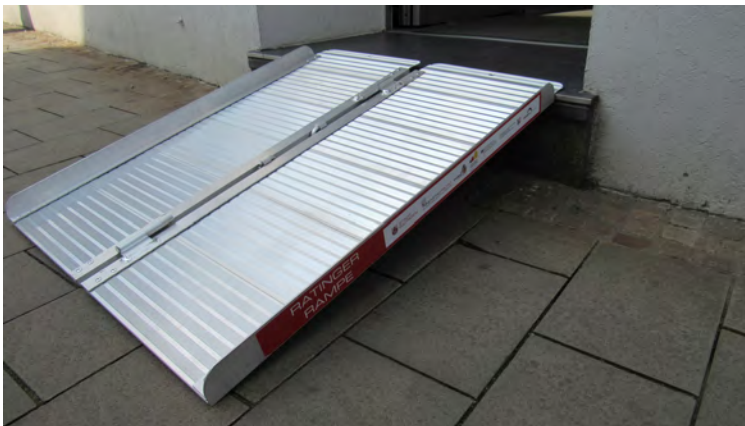
DIE RATINGER RAMPE