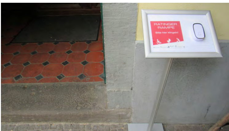
KLINGEL UND HINWEIS AUF DIE RAMPE