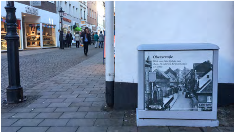
AUFGEWERTETER STROMKASTEN OBERSTRASSE