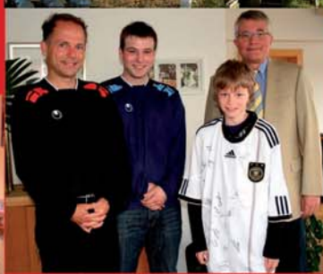
Preisverleihung mit Bürgermeister